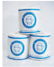
トイレトーパー 障がい者のみなさんが包装作業をしています。