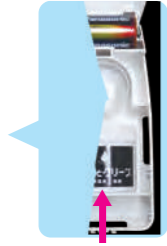
G-AIR(消臭装置) ※消臭ポリマーは1ヶ月に1個が交換目安です。

障がい者施設で製作した「あしか木製スタンド」に「G-AIR」消臭装置とトイレトーパーで社会貢献。