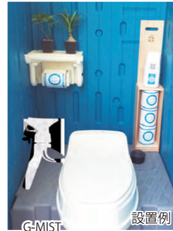
G-MIST 除菌・消臭スプレー 設置例