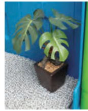
エコリーフ(S) 光触媒で空気をキレイに