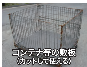
コンテナ等の敷板 (カットして使える)

ゴム配合による 高いグリップ力! 耐水性があり長期使用が可能! 軽量 で取り回しが簡単です!