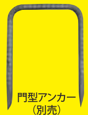
門型アンカー (別売)