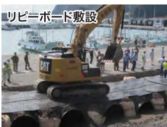
リピートボード敷設